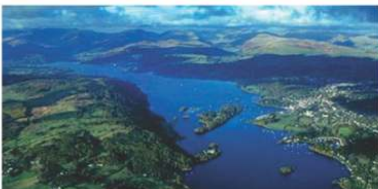
Desarrollo urbano de una región costera (riberaña).