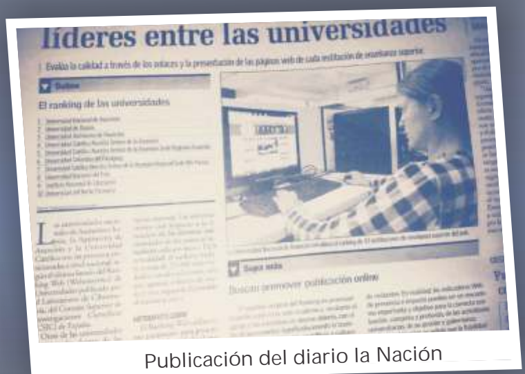
Publicación del diario la Nación