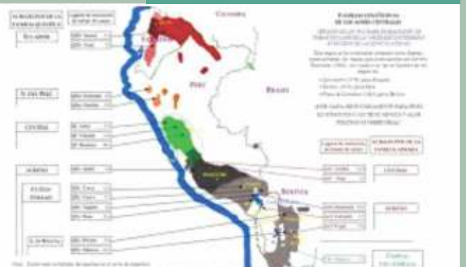
Mapa de áreas de influencia de lenguas regionales en Chile.