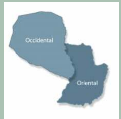
Regiones del Paraguay.

El plano físico del territorio, y más aún de la Región como espacio de interrelación de sus habitantes y generación de capital social es lo que propicia el desarrollo como objeto de cambio y transformación hacia una mejor calidad de vida de sus habitantes no sólo en el aspecto cuantitativo sino en el plano cualitativo. Dentro de esto cabe potenciar las características propias de cada región que la identifican y permiten no sólo crecer sino desarrollarse y mejorar las condiciones de vida de sus habitantes.