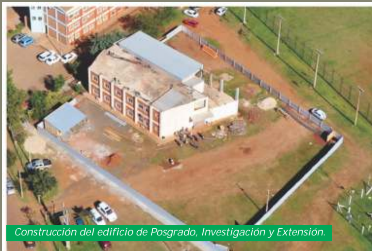
Construcción del edificio de Posgrado, Investigación y Extensión.